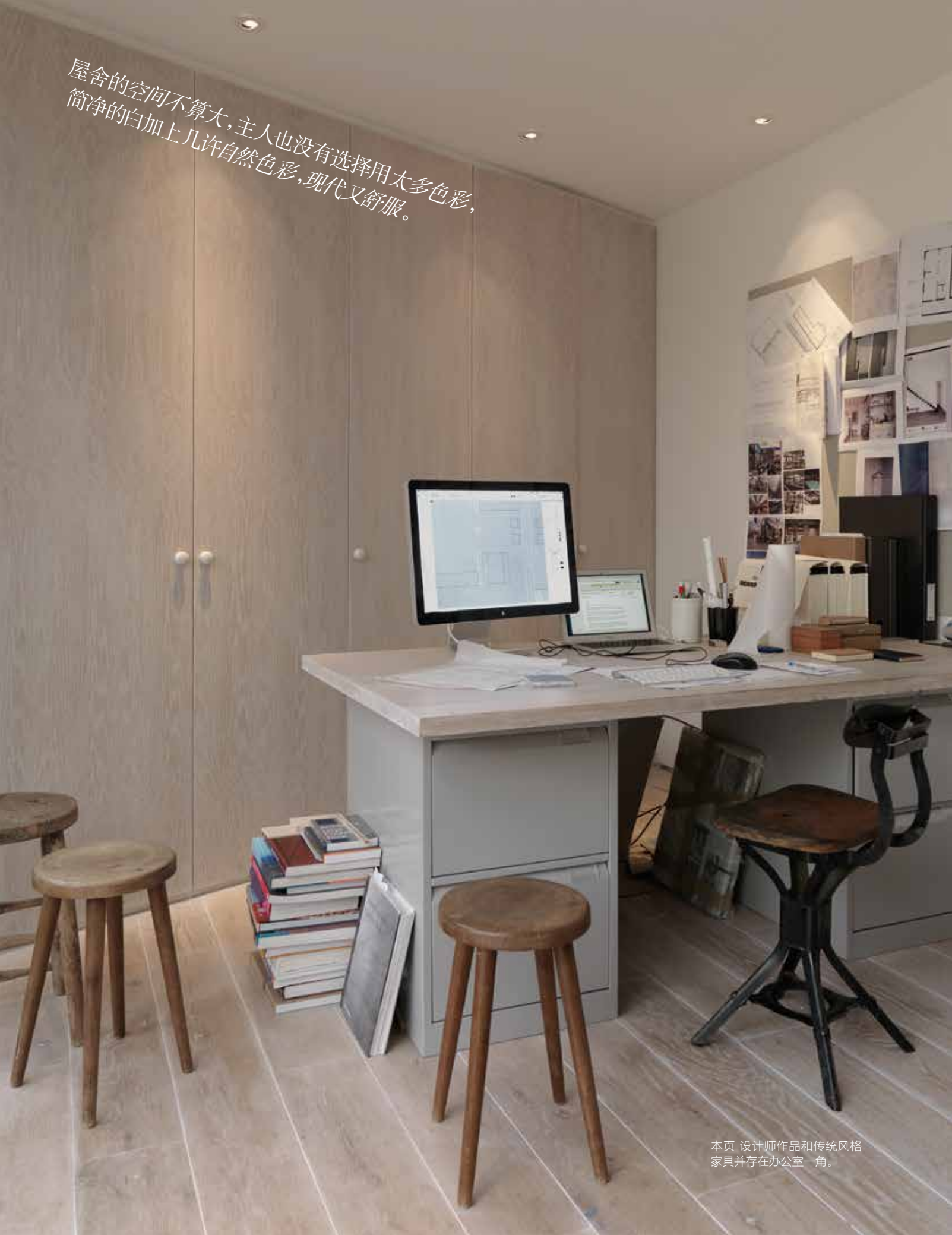
本页 设计师作品和传统风格家具并存在办公室一角。

屋舍的空间不算大,主人也没有选择用太多色彩,简净的白加上几许自然色彩,现代又舒服。